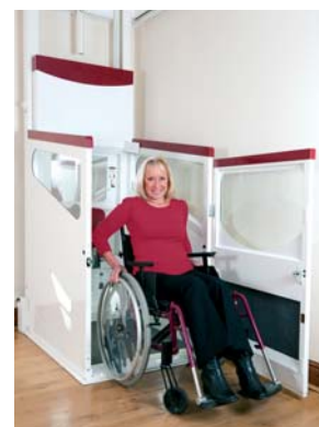
Verlassen des Lifts im Erdgeschoss