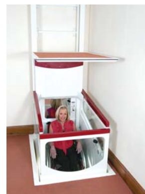
Fahrt nach unten