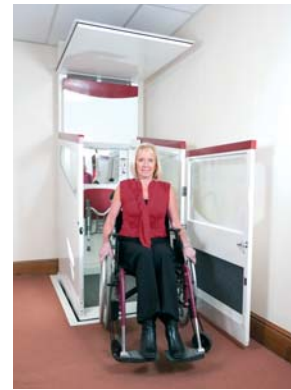
Befahren des Lifts, während er oben ist

Sowohl die Ausfuchung der Öffnung als auch die Fahrkorbunterwanne sind so konstruiert, dass sie im Brandfall mindestens eine halbe Stunde dem Feuer standhalten. Ferner verfügen beide über Rauchabdichtungen und anschwellende Feuerschutzdichtungen. Wir sind der einzige Hersteller, der dieses wichtige Sicherheitsmerkmal bereits standardmäßig für die Positionen oben und unten bietet. In die Ausfuchung der Etagenöffnung ist eine druckempfindliche Fläche integriert, die den Lift bei Vorhandensein eines Hindernisses anhält.