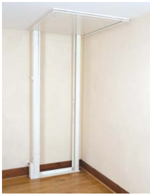
Erdgeschoss, während der Lift oben ist