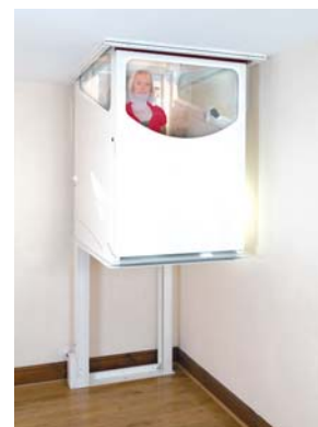
Lift erreicht das Erdgeschoss