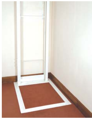
Darüber liegender Raum, wenn der Lift unten ist