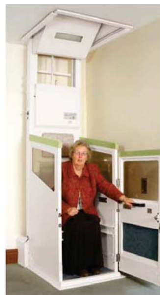
Der Harmony Compact auf der unteren Ebene mit fest integriertem Sitz.