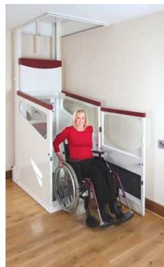
Der Harmony ermöglicht es Ihnen, problemlos und sicher die Etagen zu wechseln. Kann mit oder ohne Ihren Rollstuhl verwendet werden. Ein klappbarer Sitz ist verfügbar.

Die Bedienung ist einfach. Nachdem der Lift über die leicht zugängliche, kabellose Bedienung (ohne unansehnliche Kunststoffkabel) an der Wand, die nach den Wünschen des Nutzers angebracht wird, gerufen wurde, kann die Fahrkorbtür mit derselben Bedienung geöffnet werden. Dank der flachen, integrierten Rampe gelangen Sie problemlos mit dem Rollstuhl in den Lift, und die Fahrkorbtür wird mithilfe des internen Schalters geschlossen. Ein Druck auf den Fahrkorbschalter (der von dem Nutzer gemäß seinen Wünschen positioniert werden kann – nicht für das Compact Modell verfügbar) und der Fahrkorb fährt zur nächsten Etage und hebt oder senkt unterwegs automatisch die Deckenklappe. Der Ausstieg erfolgt in genau umgekehrter Reihenfolge.